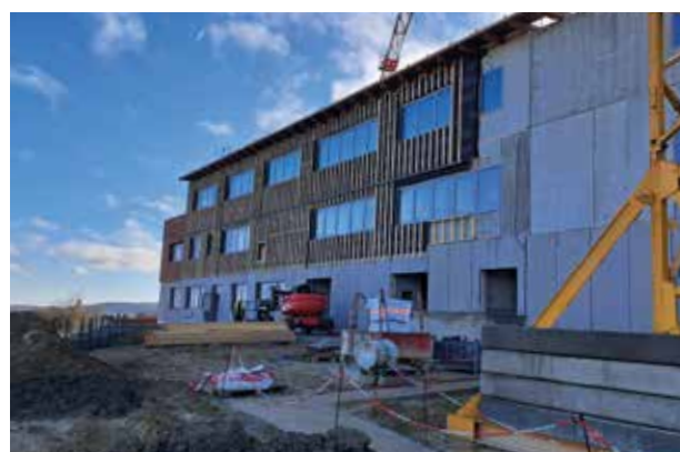
La construction avance très vite. Ci-dessus, pose du bardage bois sur le bâtiment enseignement.

L'ouverture du site d'inscription en ligne aura lieu le 3 juin : https://scolaire.transports.nouvelle-aquitaine.fr