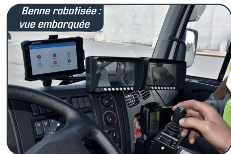
Benne robotisée : vue embarquée