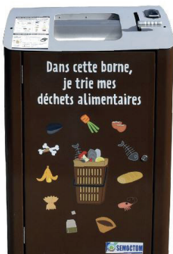
La borne de dépôt

Une carte d'accès nécessaire pour vider dans les bio-bornes. Appelez-nous !