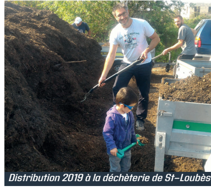
Distribution 2019 à la déchèterie de St-Loubès

Vous avez trié et permis de fabriquer du compost. Alors, venez en chercher à la déchèterie de Saint-Loubès à partir du samedi 26 septembre (dans la limite d'une petite remorque par foyer et des stocks disponibles).