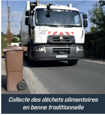
Collecte des déchets alimentaires en benne traditionnelle

Après un démarrage très réussi, et un record de 47 kg/an/habitant fin mars, l'été fut plus délicat. A cette période, les déchets sont plus humides (sacs qui peuvent craquer) et les températures élevées favorisent le développement des insectes. La tentation est forte de stopper totalement le tri de ses déchets alimentaires, pourtant il est souvent possible de trouver des solutions pour donner une seconde vie à ses déchets.